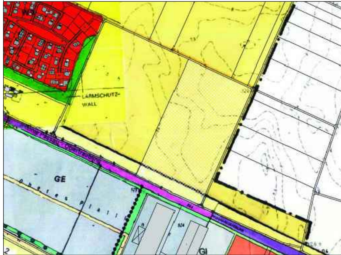
DECKBLATT NR. 23 ZUM FNP