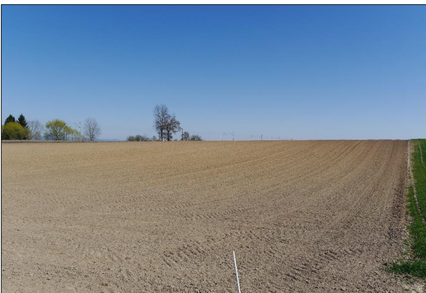
Blick vom südwestlichen Ende auf das Plangebiet.