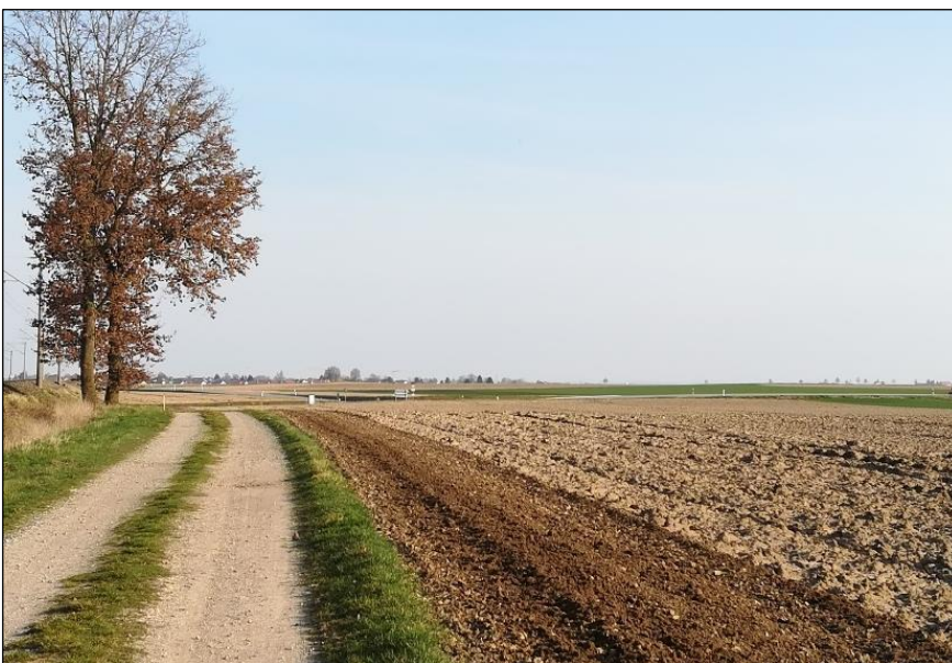
Blick vom nördlichen Feldweg auf das östliche Plangebiet.