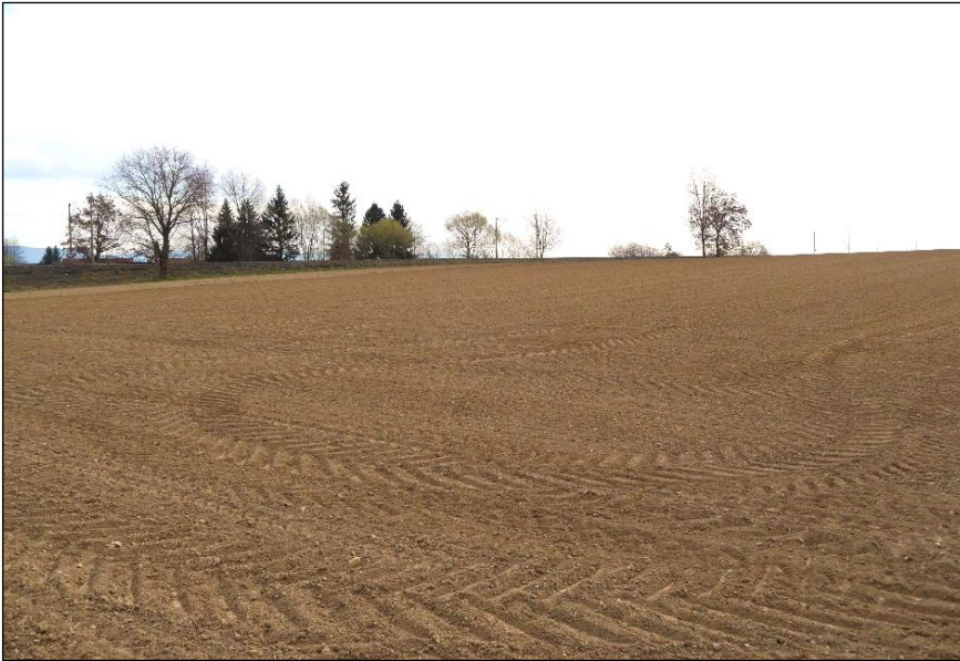
Blick vom westlichen Feldweg nach Nordosten.