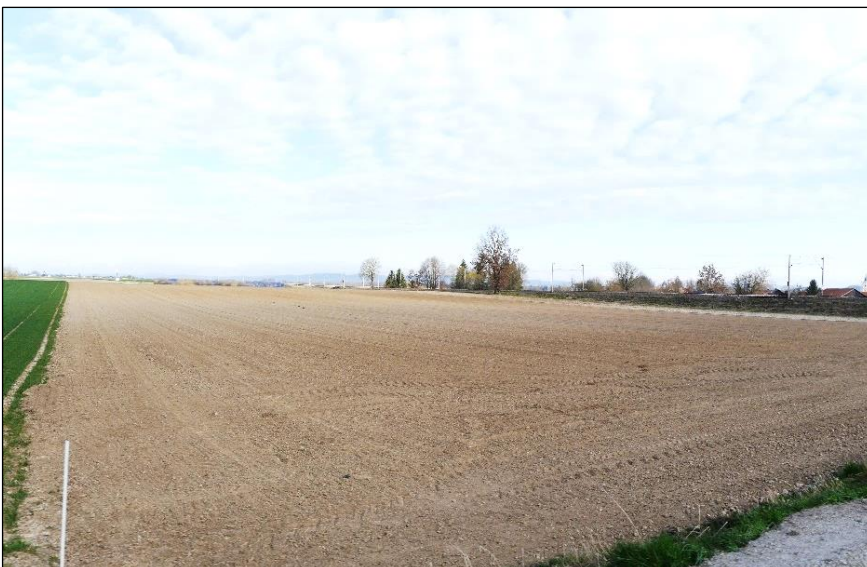
Blick vom südöstlichen Ende auf das Plangebiet.