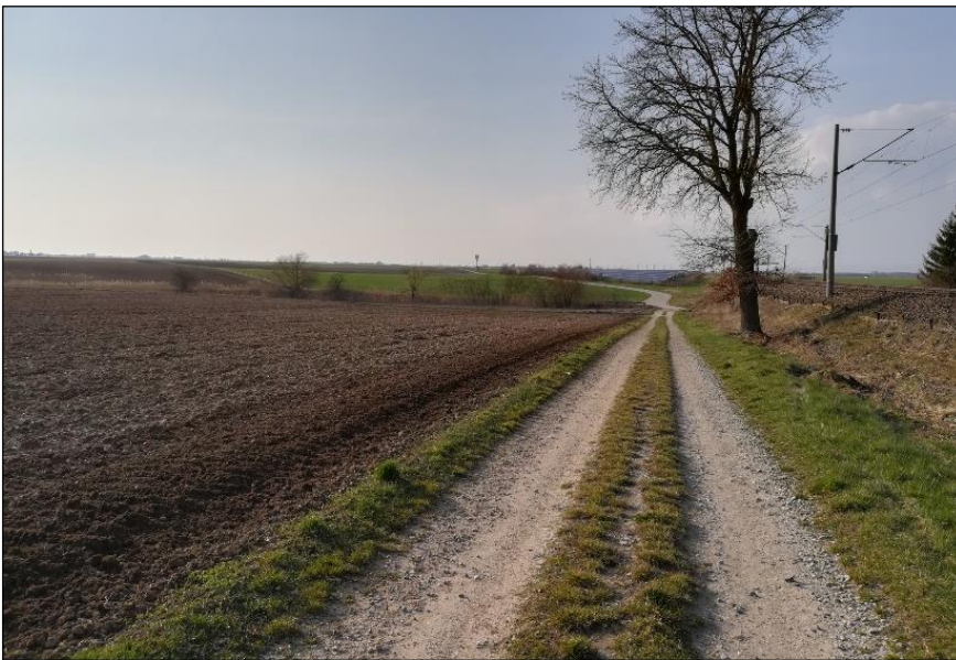
Blick vom nördlichen Feldweg auf das westliche Plangebiet.

Im Plangebiet liegen keine amtlich kartierten Biotope sowie gesetzlich geschützte Flächen im Sinne des § 30 BNatSchG.