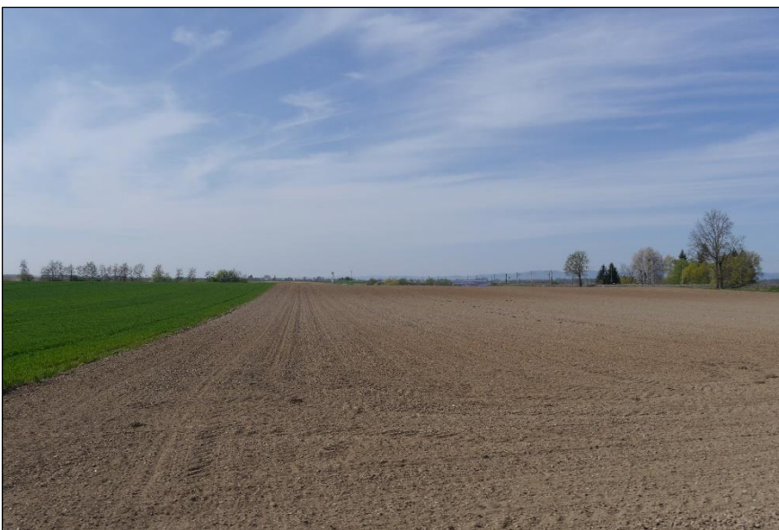
Blick vom Südost-Eck auf das Plangebiet