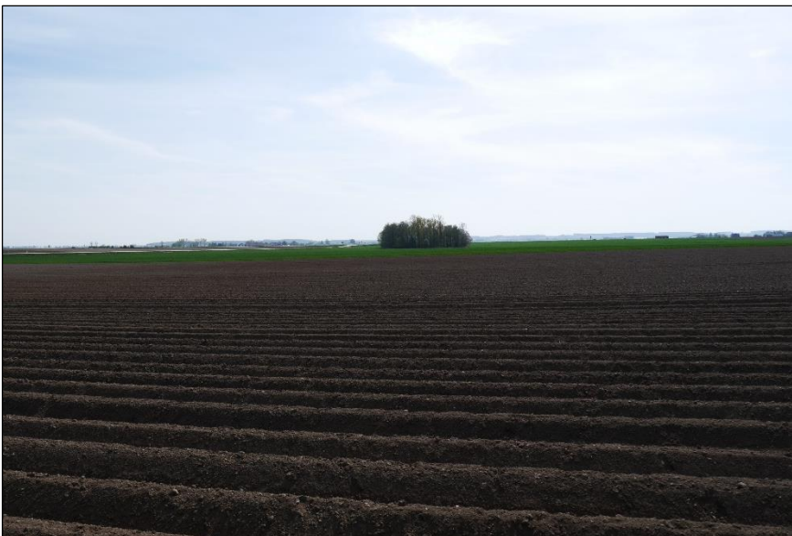
Blick von Norden auf das Plangebiet