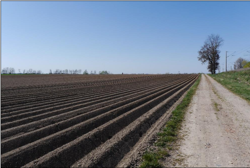
Blick vom nördlichen Feldweg nach Südwesten.