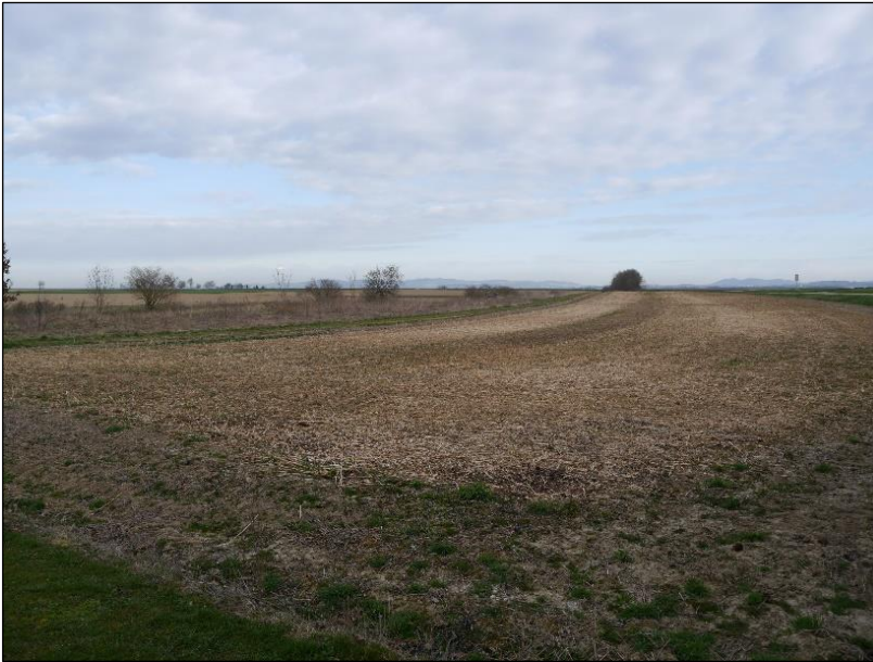
Blick von Süden auf die Teilfläche des Flurstücks 165